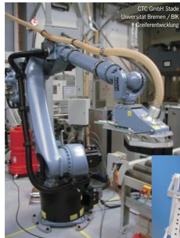
CTC GmbH Stade Universität Bremen / BIK Greiferentwicklung