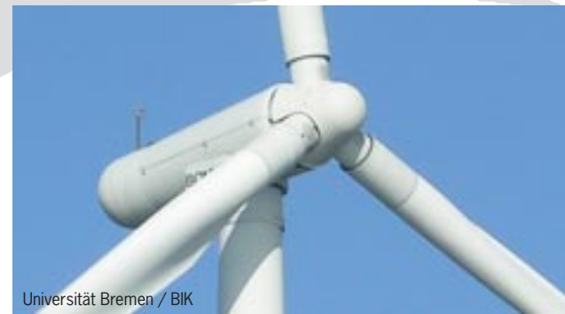
Universität Bremen / BIK