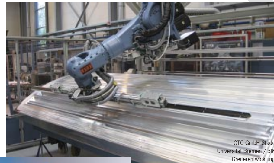
CTC GmbH Stade Universität Bremen / BIK Greiferentwicklung