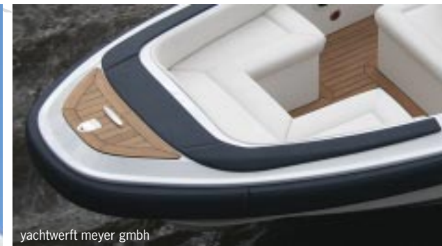
yachtwerft meyer gmbh