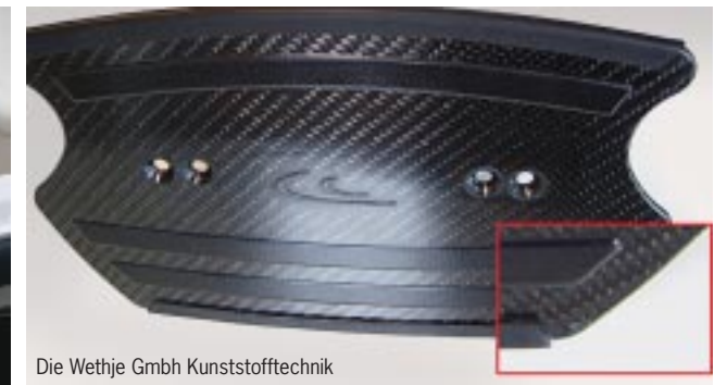
Die Wethje GmbH Kunststofftechnik