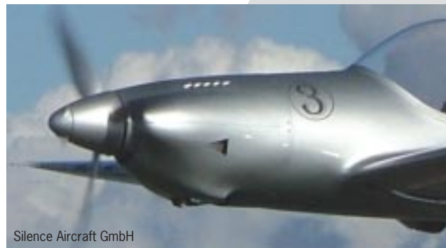
Silence Aircraft GmbH